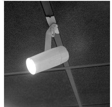
Clamp them to ceilings with the included scissor clip