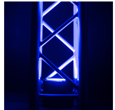
Design compact permettant de l'insérer facilement à l'intérieur des barres de TRUSST