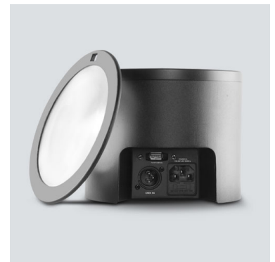
Boîtier robuste à placer à plat